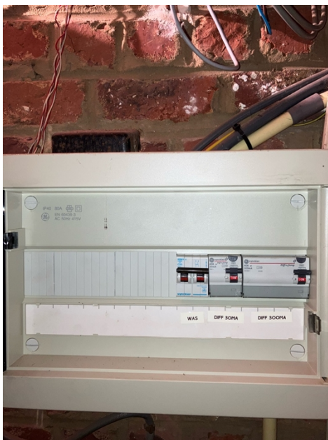
( Elektrisch bord )