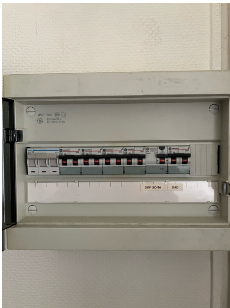
( Elektrisch bord )